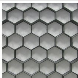
Nidagravel 129 noir 120x80x2,9cm