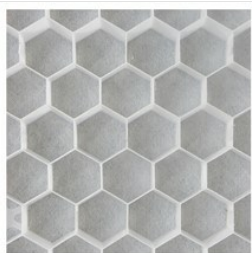
Nidagravel 129 blanc 120x80x2,9cm