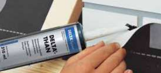
Voorbeeld van installatie op de schoorsteen.