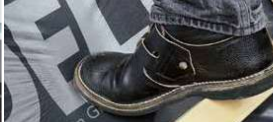
Maximale veiligheid bij het lopen op het dak.