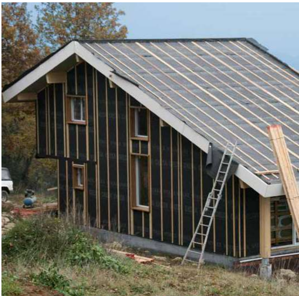
DELTA®-VITAXX PLUS gebruikt op het dak en op de gevel van het gebouw.